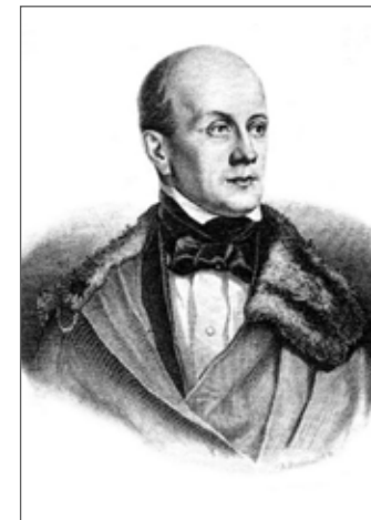
П.Я. Чаадаев, философ, публицист, общественный деятель

“Твое заключение о Пушкине справедливо: в нем точно есть еще варварство (из письма брату)”.