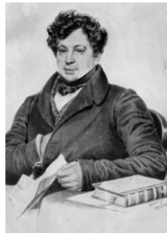
А.И. Тургенев, историк, чиновник, общественный деятель

“Пушкин в стихах своих "Клеветникам России" кажет им шиш из кармана. Он знает, что они не прочтут стихов его, следовательно, и отвечать не будут на вопросы... Народные витии, если удалось бы им как-нибудь проведать о стихах Пушкина и о возвышенности таланта его могли бы отвечать ему коротко и ясно: мы ненавидим, или лучше сказать презираем вас, потому что в России поэту, как вы, не стыдно писать и печатать стихи, подобные вашим”.