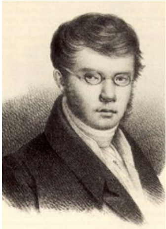
П.А. Вяземский, поэт, критик, публицист, государственный деятель

“Пушкин в стихах своих "Клеветникам России" кажет им шиш из кармана. Он знает, что они не прочтут стихов его, следовательно, и отвечать не будут на вопросы... Народные витии, если удалось бы им как-нибудь проведать о стихах Пушкина и о возвышенности таланта его могли бы отвечать ему коротко и ясно: мы ненавидим, или лучше сказать презираем вас, потому что в России поэту, как вы, не стыдно писать и печатать стихи, подобные вашим”.